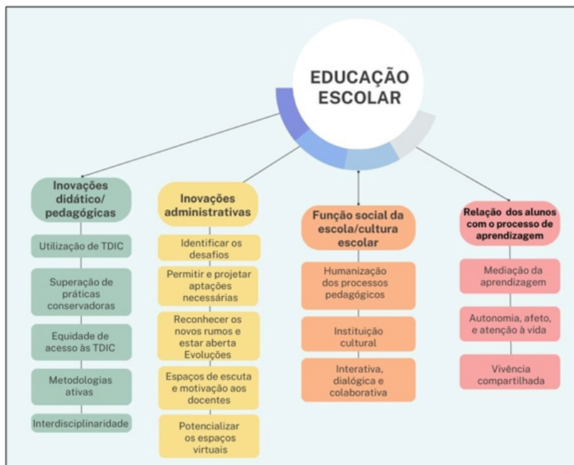
Figura 3 – Categorias de temáticas encontradas nas pesquisas analisadas.