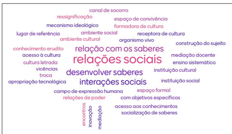
Figura 4 – Nuvem de palavras: concepções de educação escolar

Desse modo, alguns conceitos--chaves que expressam essas concepções foram colocados na plataforma online de criação e compartilhamento de apresentações interativas “Mentimeter”, a fim de verificar o que se apresenta em maior relevância dentre os conceitos. A seguir, apresenta-se uma imagem denominada “nuvem de palavras”, com o resultado dessa investigação.