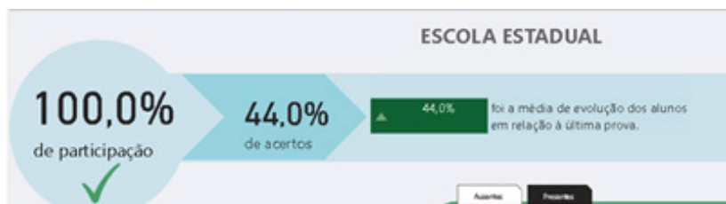
Imagem 1: evolução dos alunos na prova paulista do 3º bimestre